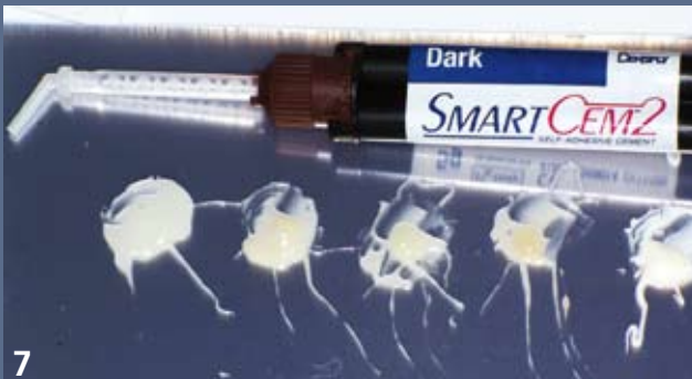
7 Cinq teintes disponibles pour le SmartCem™ 2 de Dentsply mais pas de pâte d'essayage. En pratique, peu de soucis, les assemblages les plus exigeants esthétiquement n'étant pas dans le domaine d'application de cette famille de colles.