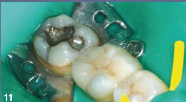
11 Immédiatement après l'assemblage : l'élimination des excès est aisée, le résultat esthétique immédiat très satisfaisant.