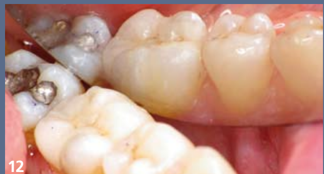
12 Contrôle à une semaine : absence de sensibilité postopératoire, bonne intégration esthétique et fonctionnelle, patient et praticien sont ravis !