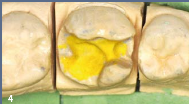
4 Modèle de travail issu d'une empreinte aux silicones par addition, préparé pour l'élaboration de l'inlay en céramique.