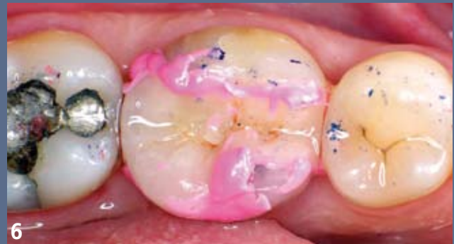
6 Essayage clinique de la restauration. L'utilisation d'un silicone de basse viscosité permet de vérifier la bonne adaptation de l'intrados prothétique à la préparation.