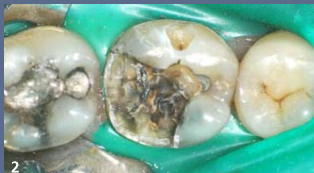
2 Dépose des restaurations et résection des parois affaiblies.