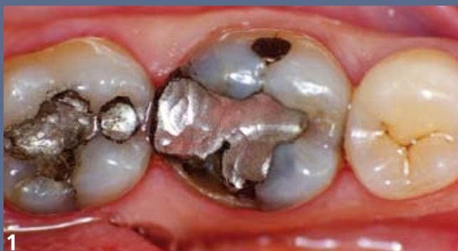
1 Situation initiale : fracture de la cuspidé disto-linguale de cette molaire mandibulaire porteuse d'une volumineuse restauration à l'amalgame.

Thac BUI QUOC 22 avenue du Bel Air 75012 Paris