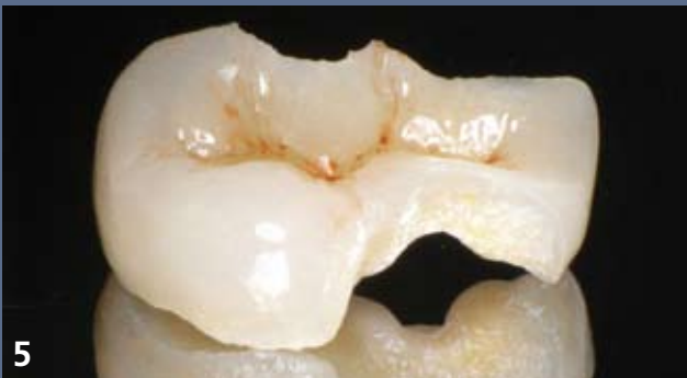
5 Inlay en céramique réalisé par le laboratoire Art-Email à Chatenay-Malabry (céramique Noritake EX3).