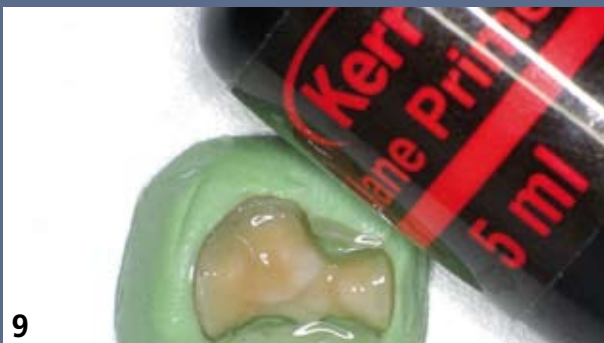
9 Le silanage est réalisé en suivant scrupuleusement les indications de son fabricant.