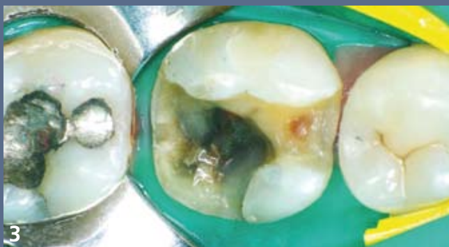
3 Aménagement de la cavité incorporant le traitement de la lésion proximale révélée par l'examen radiographique. La cavité vestibulaire est obturée en technique directe.