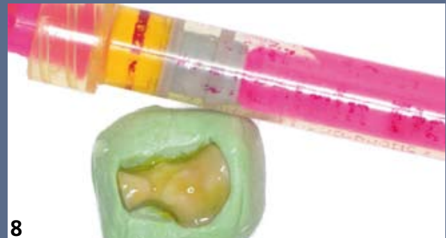
8 Mordançage à l'acide fluorhydrique de l'intrados de l'inlay. Le coffrage de la pièce prothétique dans un bloc de silicone haute viscosité facilite les manipulations et protège l'extrados des effets du mordançage.